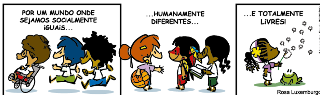
Tirinha do Armandinho cedida por Alexandre Beck para publicação no site do Inesc.

Art. 3º “A criança e o adolescente gozam de todos os direitos fundamentais inerentes à pessoa humana, sem prejuízo da proteção integral de que trata esta Lei, assegurando-se lhes, por lei ou por outros meios, todas as oportunidades e facilidades, a fim de lhes facultar o desenvolvimento físico, mental, moral, espiritual e social, em condições de liberdade e de dignidade”. (BRASIL, Lei 8.069/1990)