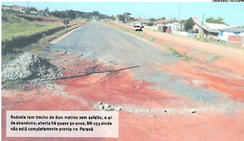
LUCAS ALEXIO - FOLHA EXTRA

O aspecto de “rodovia fantasma” na BR-153 em Ventania, nos Campos Gerais, pode estar prestes e ser transformado após quase 50 anos de espera. O asfalto entre o município e Tibagi chegou finalmente em 2008, mas um trecho de apenas 600 metros, no perímetro urbano de Ventania, continuou sem pavimentação, já que uma vila havia se formado naquele local e a prefeitura precisou realocar os moradores. Assim, mesmo pronto, o trajeto de mais de 40 quilômetros parece nunca ter sido inaugurado e segue com movimento aquém do esperado. Agora, a rodovia pode finalmente ter este trajeto completo. Destaques Página A6